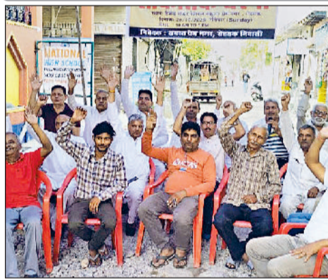
रोहतक। धरना देते कालोनी निवासी एवं टूटी हुई सड़क।

कॉलोनीयों के लोगों को दूषित पेयजल और सीवर ओवरफ्लो की समस्या से जूझना पड़ रहा है। शिकायत करने के बाद भी अधिकारियों द्वारा समाधान नहीं किया जा रहा।