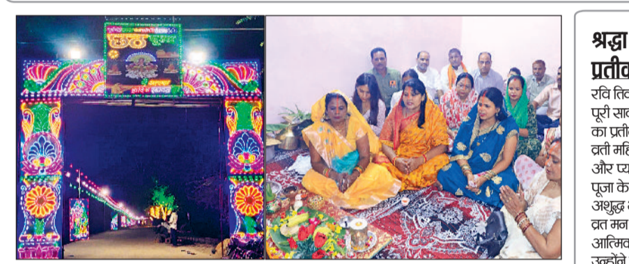
रोहतक। घर में पूजा अर्चना करते

भगवान सूर्य की उपासना का महापर्व छठ पूजा रविवार को पूरे आस्था और श्रद्धा के साथ रोहतक में शुरू हो गया। बिहार और पूर्वांचल की परंपरा अब रोहतक में भी रच-बस चुकी है। शहर और आस-पास के इलाकों में महिलाओं ने रविवार को खरना का व्रत रखकर भगवान सूर्य और छठी मइया की आराधना की। शनिवार को श्रद्धालुओं ने नहाय-खाय के साथ इस पर्व की शुरुआत की थी। इसके बाद रविवार को महिलाओं ने दिनभर उपवास रखा और शाम को अपने घरों में शुद्ध मिट्टी से नया चूल्हा बनाकर गुड़ की खीर, रसिया और रोटी तैयार की। इसी प्रसाद को ग्रहण कर उन्होंने 36 घंटे के निर्जला व्रत की शुरुआत की, जो मंगलवार की सुबह उगते सूर्य को अर्घ्य देने के बाद समाप्त होगा। ब्रतियों ने बताया कि यह पर्व केवल धार्मिक अनुष्ठान नहीं, बल्कि आत्म-शुद्धि, संयम और मातृत्व का प्रतीक है। छठ पूजा को सूर्य व्रत भी कहा जाता है और इसके महत्व का उल्लेख स्कंद पुराण और पद्म पुराण में मिलता है।