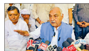
रोहतक। पत्रकारों से रुबरु होते पूर्व सीएम भूपेंद्र सिंह हुड्डा।

किसान की फसलों पर एमएसपी व मुआवजा और जनता को सुरक्षा देने में नाकाम है सरकार हरिभूमि न्यूज | रोहतक