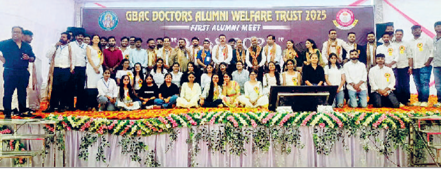
कहना है कि आयुर्वेद भारतीय चिकित्सा प्रणाली की आत्मा है। आज जब दुनिया प्राकृतिक उपचार की ओर लौट रही है, तब आयुर्वेद का महत्व और भी बढ़ गया है। इस कॉलेज ने वर्षों से जो सेवा की है, वह समाज के स्वास्थ्य के लिए अमूल्य योगदान है। जीबीएसी ट्रस्ट के प्रधान

गौड ब्राह्मण आयुर्वेदिक कॉलेज, ब्राह्मणवास में रविवार को कॉलेज की पहली एलुमनी मीट का भव्य आयोजन हुआ। जिसमें मुख्य अतिथि एसडीएम डॉक्टर आशीष वशिष्ठ रहे। यह कार्यक्रम कॉलेज की पहली पाँचगण बैच वर्ष 1974 से लेकर अब तक के 51 वर्षों की गौरवशाली यात्रा को समर्पित रहा। इस मौके पर देशभर से 600 से अधिक आयुर्वेदिक डॉक्टर पहुंचे। आयोजन का संचालन जीबीएसी डॉक्टर्स एलुमनी वेलफेयर ट्रस्ट 2025 द्वारा किया गया। एसडीएम डॉ. आशीष वशिष्ठ का