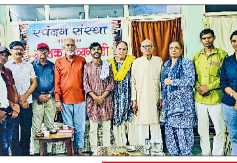
हरिभूमि न्यूज ▶▶ रोहतक