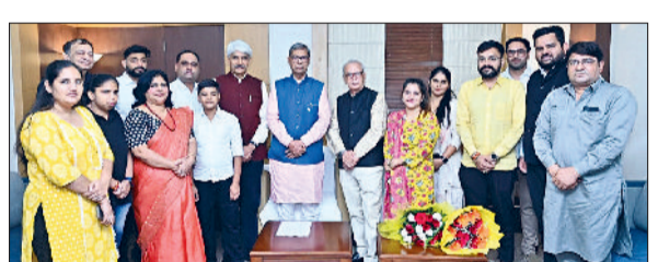
हरिभूमि न्यूज ▶▶ रोहतक