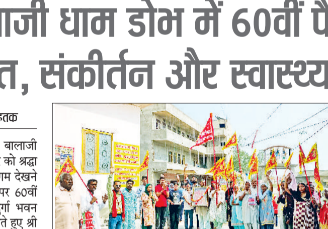
रोहतक। यात्रा निकालते हुए भक्तजन।