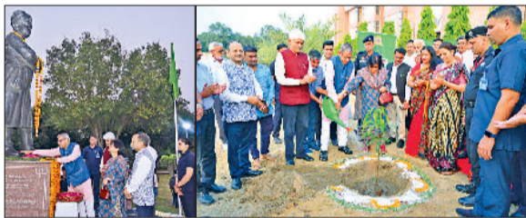
हरिभूमि न्यूज ▶▶ रोहतक