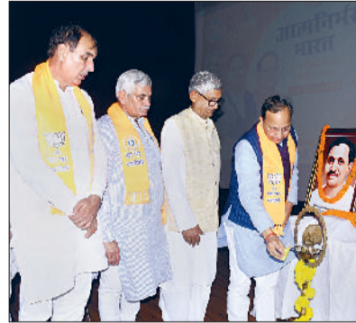
रोहतक। दीप प्रज्वलित कर कार्यक्रम का शुभारंभ करते भारतीय जनता पार्टी के राष्ट्रीय महासचिव, राज्यसभा सांसद अरुण सिंह और मौजूद लोग।